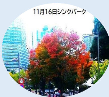
11月16日シンクパーク