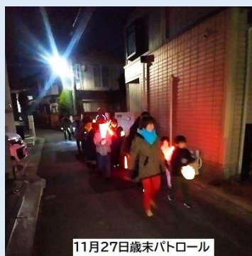
11月27日歳末パトロール