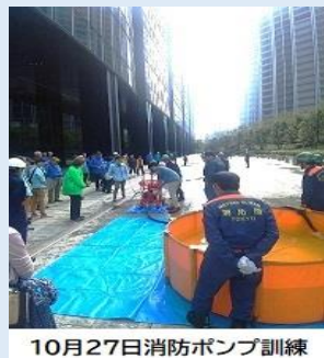
10月27日消防ポンプ訓練