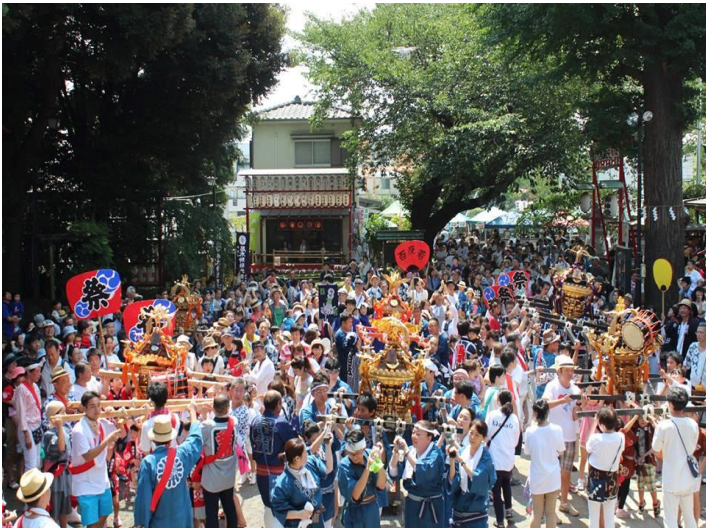
(祭りだよ・全員集合)