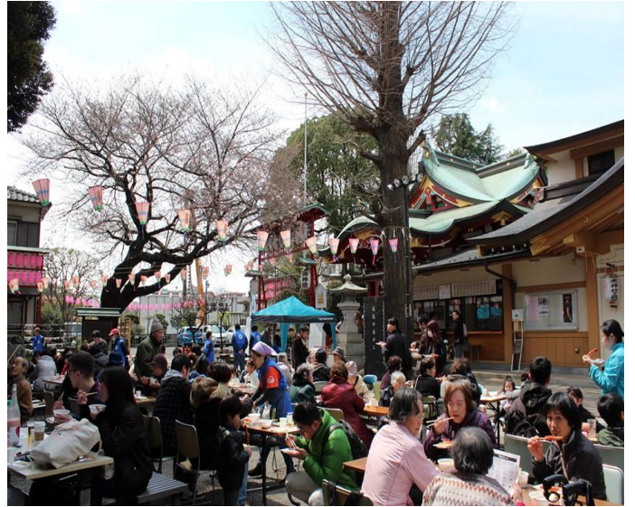
(花見だよ・みんな集合)